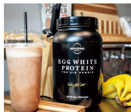
卵白由来のプロテインパウダー「REVOPRO」

過去最大規模の鳥インフルエンザ発生の影響が深刻化している。鶏卵市場はかつてないほど需給がひっ迫。液卵業界でも仕入れは困難を極め、高まる需要に応えられない。業界存亡にも関わる環境下で、イフジ産業が新たな方針を打ち出した。逆境をチャンスに変えてビジネスモデルを見直し売上高200億円突破に動き出す。